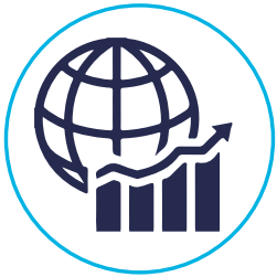
Strategia Agresywna Globalna