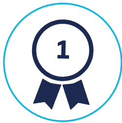
Najlepsza strategia w swojej grupie wg. Gazety Parkiet