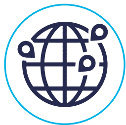
Strategia Zrównowazona Globalna