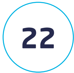
Liczba dostępnych funduszy