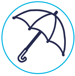
Strategia Absolut Return