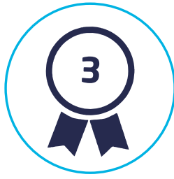
Trzecia, najlepsza strategia w swojej grupie wg. Gazety Parkiet